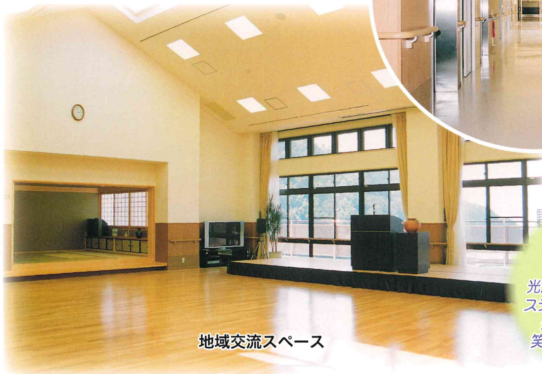
地域交流スペース

海が見える 地域交流スペース。 そこには 光がやさしく降り注ぎ、 ステージや和室もある。 多種多様な交流に 笑顔の輪が広がる。